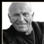
ENZO G. CASTELLARI